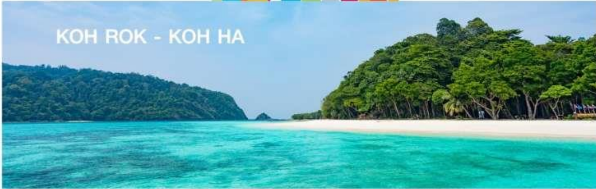
KOH ROK - KOH HA

(ออกเดินทางวันที่ 21 และ 27 ก.พ. เดือนอื่นๆ สอบถามเพิ่มเติม)