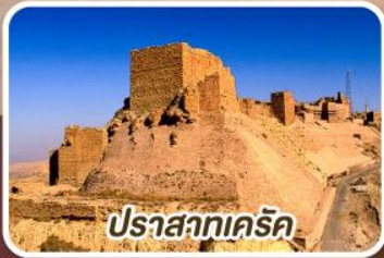
ปราสาทเคิร์ด