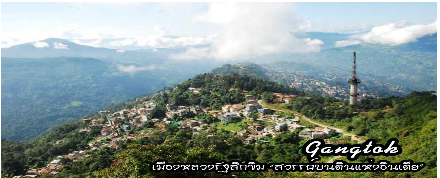
Gangtok เมืองหลวงรัฐสิกกิม "สวรรค์บนดินแห่งอินเดีย"

08.00 น. นำท่านออกเดินทางสู่ เมืองดาร์จีลิง - เมืองกันต็อก ( Gangtok ) ระยะทาง 96 ก.ม. ใช้เวลาเดินทางประมาณ 4-5 ชั่วโมง (ขึ้นอยู่กับการจราจร)