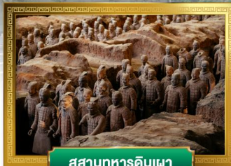
สุสานทหารดินเผา