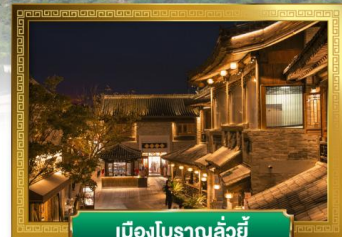
เมืองโบราณลั่วยี่