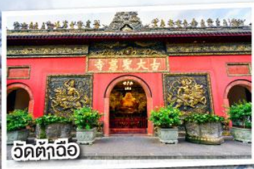
วัดต้าเจี๊ว