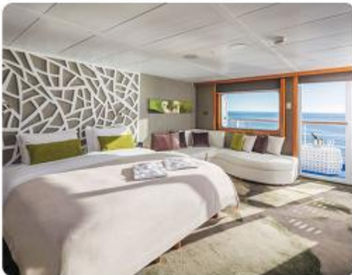
Legend Balcony Suite