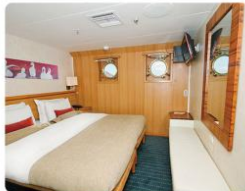
Junior Suite Plus & Junior Suite