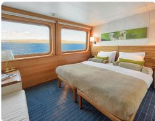
Junior Suite Plus & Junior Suite