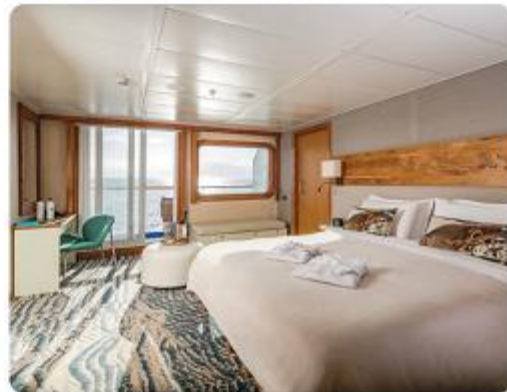
Balcony Suite Plus & Balcony Suite