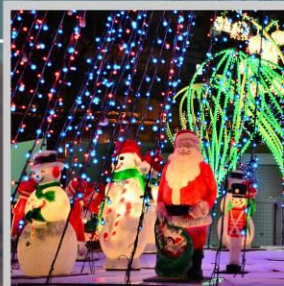
"ODORI GERMAN CHRISTMAS"