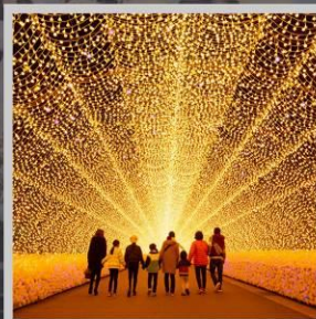
“NABANA NO SATO”