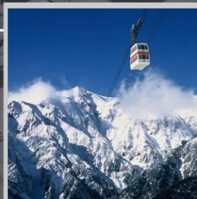
“SHIN HOTAKA ROPEWAY”