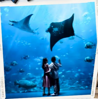
ZONE 7 : FAR FAR AWAY