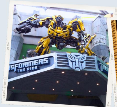
ZONE 1 : HOLLYWOOD