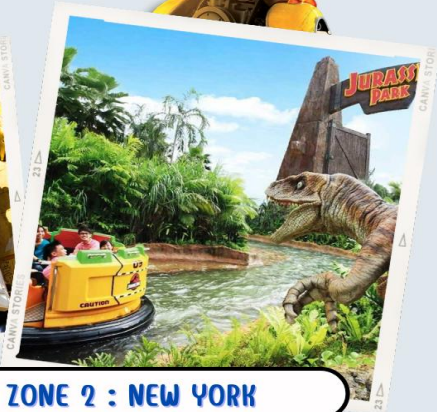
ZONE 2 : NEW YORK