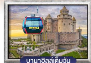
บาน่าฮิลล์เต็มวัน