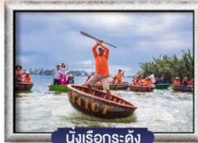
นั่งเรือกระดังง์