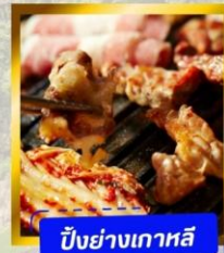
ปิ้งย่างเกาหลี