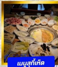
เมนูสุกี้เห็ด