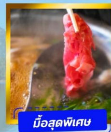
มั่วสดพิเศษ