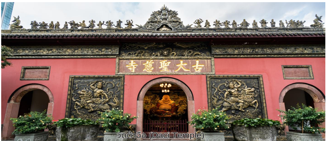
วัดต้าฉือ (Daci Temple)

บ่าย จากนั้นเดินทางไปยัง วัดต้าฉือ เป็นวัดเก่าแก่ที่มีอายุยาวนานกว่า 1,600 ปี ตั้งอยู่ใจกลางของ Chengdu ที่นี่ถือเป็นสถานที่สำคัญที่น่าสนใจ เพราะเป็นวัดที่พระถังซัมจั๋งบวชเป็นพระภิกษุ ก่อนจะย้ายไปจำพรรษายังวัดอื่นภายในวัดต้าฉือนั้นเงียบสงบ