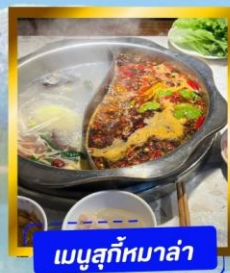
เมนูสุกี้หม่าล่า