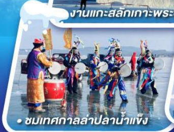
• ชมเทศกาลล่าน้ำแข็ง