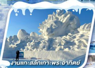
งานแกะสลักเทพะระอาทิตย์