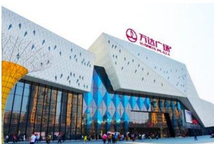
ห้างวังก์ต้าสแควร์

โรงแรม HARBIN REZEN HOTEL โรงแรมระดับ 4 ดาวห้องถ้ำหรือเทียบเท่าในเมืองฮาร์บิน