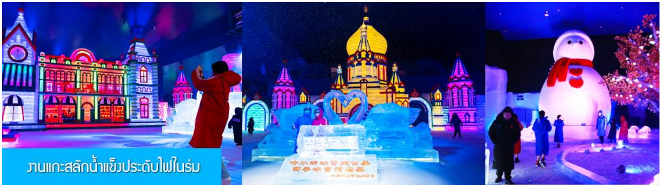
งานแกะสลักน้ำแข็งประดับไฟในร่ม

นำท่านเที่ยวชม งานแกะสลักน้ำแข็งประดับไฟในร่ม 哈尔滨冰雪小世界