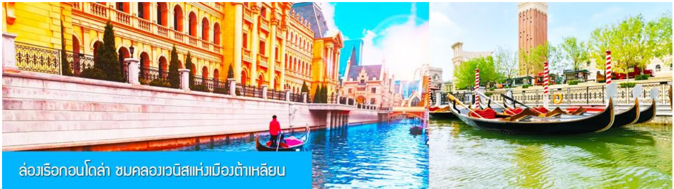
ล่องเรือกอนโดล่า ชมคลองเวนิสแห่งเมืองต้าเหลียน