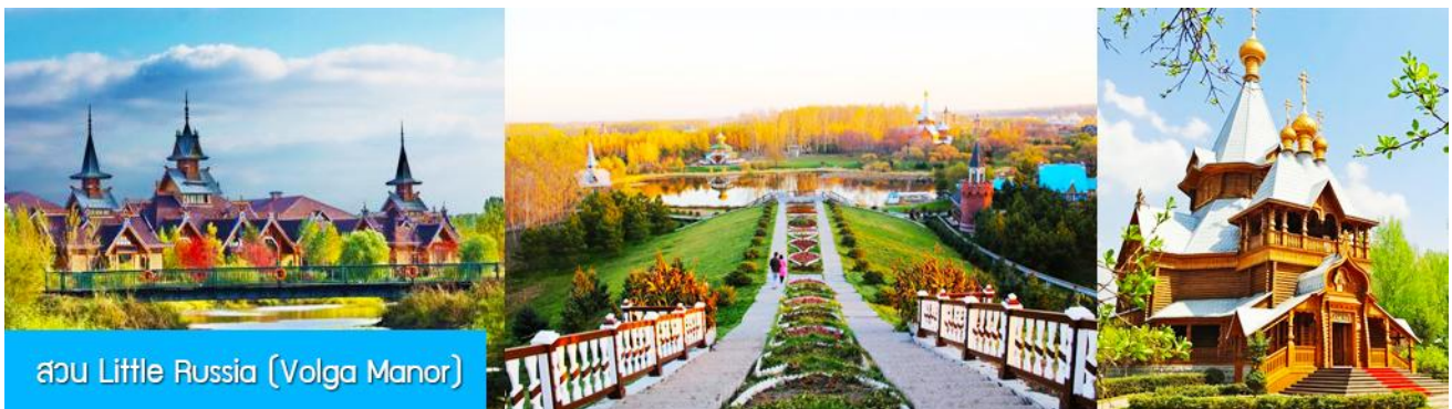
สวน Little Russia (Volga Manor)

จากนั้นนำท่านเที่ยวชม สวน LITTLE RUSSIA (VOLGA MANOR) 伏尔加庄园