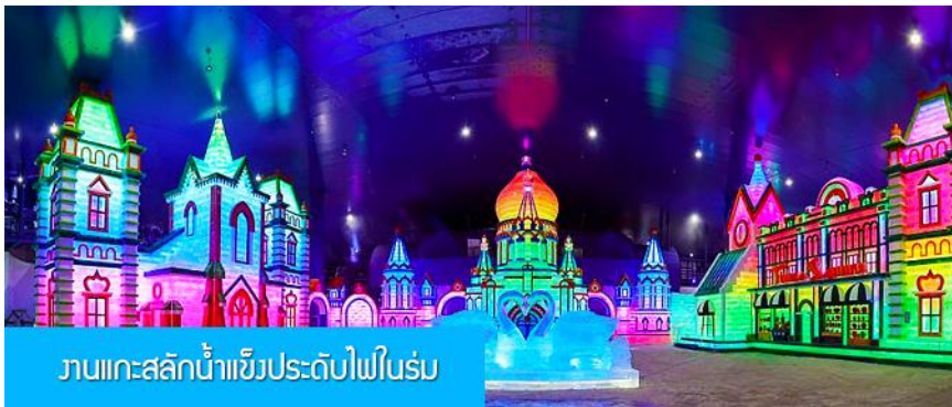
งานแกะสลักน้ำแข็งประดับไฟในร่ม

พักที่ VODKA MANOR RESORT รีสอร์ทที่ตั้งอยู่ในอุทยานสวนสไตล์รัสเซีย