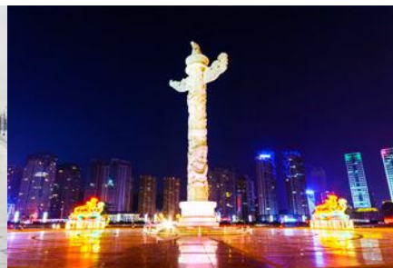
จัตุรัสซิงไห่