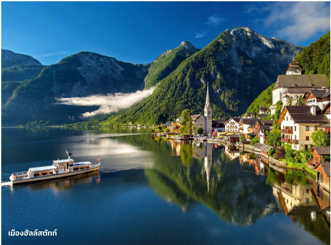
เมืองฮัลล์สตัดท์