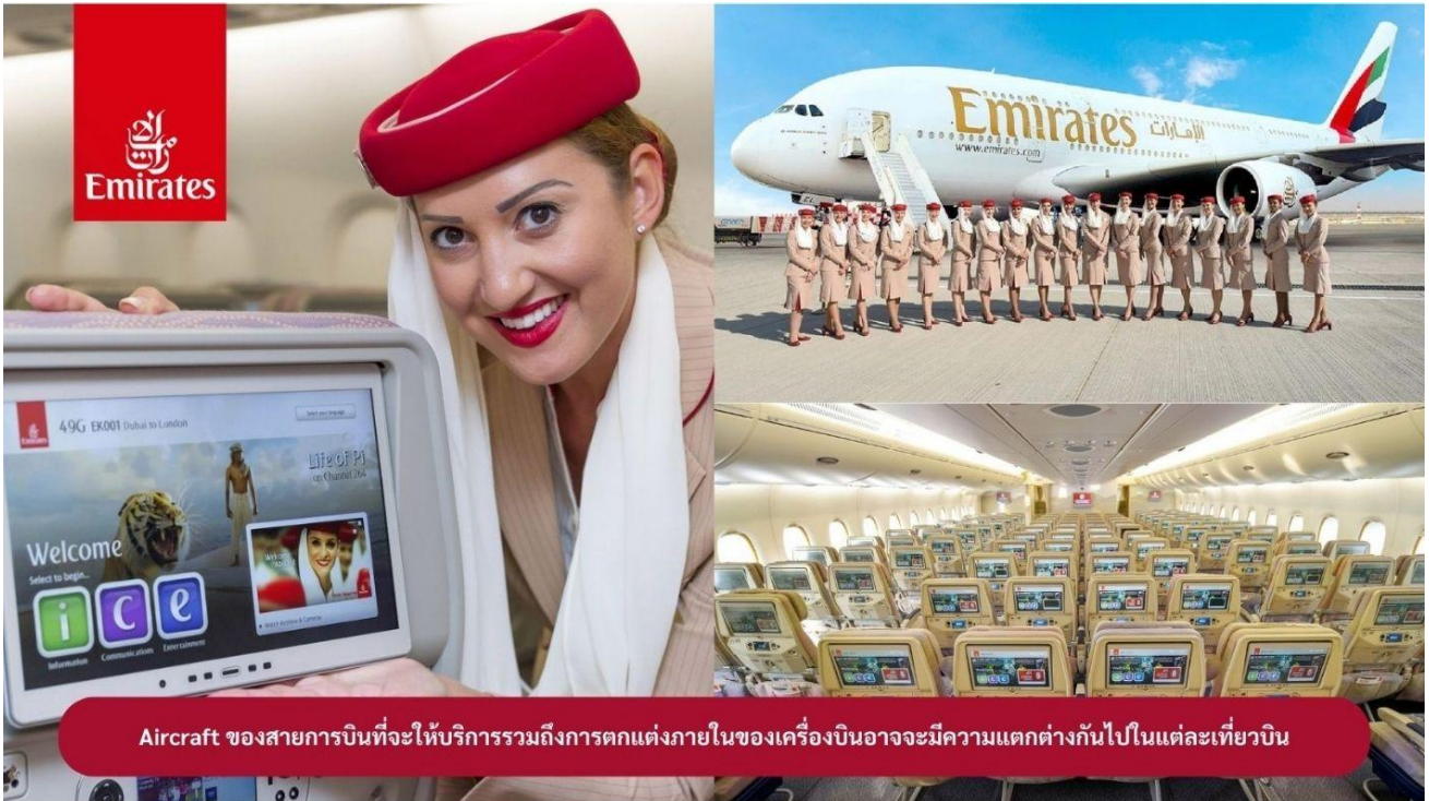
Aircraft ของสายการบินที่จะให้บริการรวมถึงการตกแต่งภายในของเครื่องบินอาจจะมีความแตกต่างกันไปในแต่ละเที่ยวบิน

e-mail: tour.aaj@gmail.com , Web Site: www.allabout-journey.com