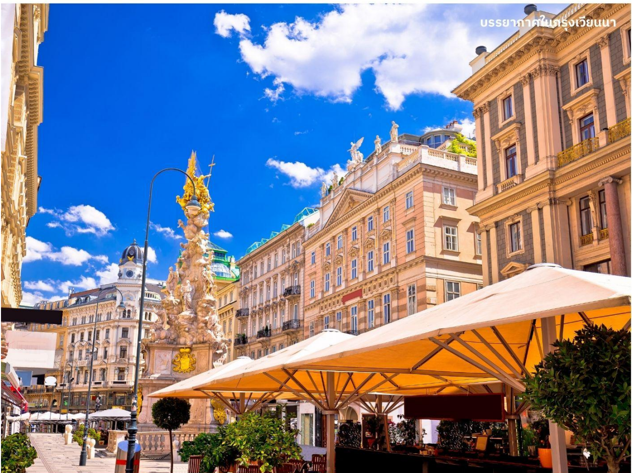
บรรยากาศในกรุงเวียนนา

จากนั้นนำท่านถ่ายรูปกับ วิหารเซนต์สตีเฟน วิหารที่ตั้งตระหง่านอยู่กลางกรุงเก่าเวียนนา เป็นศิลปะโรมาเนสก์ โดดเด่นด้วยการตกแต่ง หลังคากระเบื้องสีสันสวยงาม