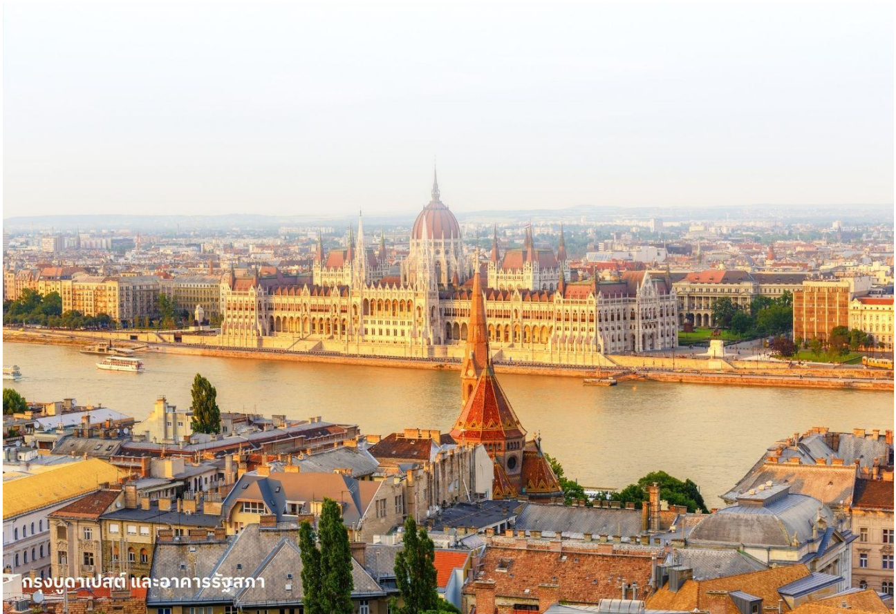
กรุงบูดาเปสต์ และอาคารรัฐสภา

นำท่านเข้าสู่ที่พัก Park Inn By Radisson Budapest หรือเทียบเท่า