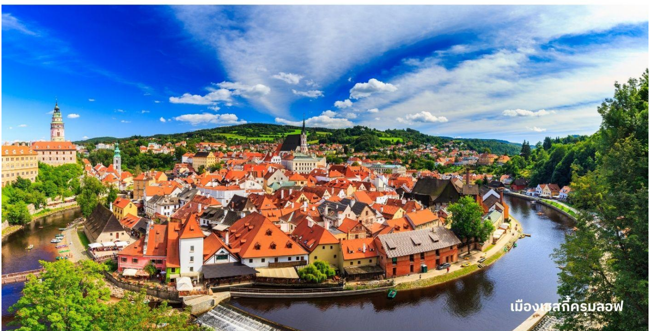
เมืองเชสกีครุมลอฟ

นำท่านเข้าสู่ที่พัก Hotel Bellevue Cesky Krumlov หรือเทียบเท่า