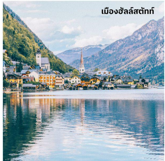
เมืองฮัลล์สตัดท์