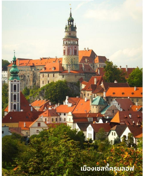
เมืองเชสกีครุมลอฟ

อิสระให้ท่านเดินเที่ยวชมเมืองโบราณตามอัธยาศัย