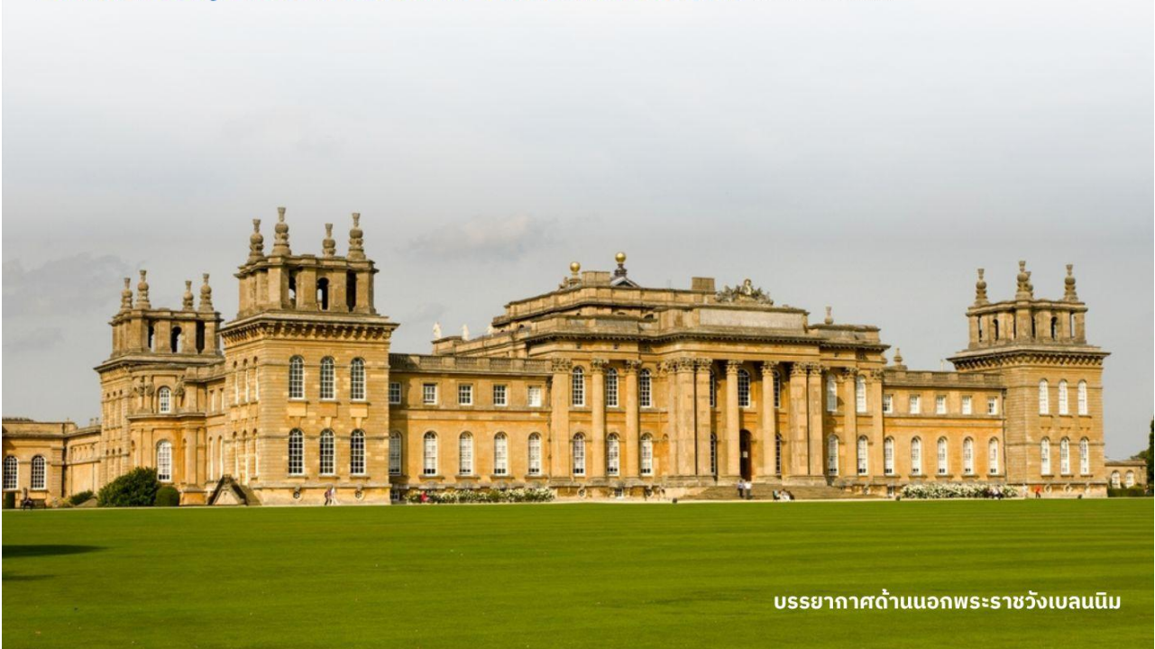
บรรยากาศด้านนอกพระราชวังเบลนนิม

DoubleTree by Hilton Hotel Londo -Docklands Riverside หรือเทียบเท่า