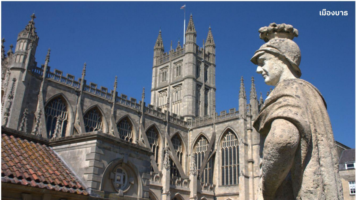
เมืองบาร

หลังจากนั้นนำท่านเดินทางสู่ เมืองบาร ดินแดนแห่งอาณาจักรโรมันอันยิ่งใหญ่บนเกาะอังกฤษเมื่อ กว่า 2,000 ปีมาแล้ว ใช้เวลาเดินทางประมาณ 1.30 ชั่วโมง นำท่านเข้าชม โรงอาบน้ำแร่โรมัน ที่ชาวโรมันมาสร้างไว้เป็นสถานที่อาบน้ำแร่โดยอาศัยน้ำจากบ่อน้ำแร่ธรรมชาติที่จะมีน้ำไหลออกมาอย่าง ต่อเนื่องถึงวันละประมาณ 1,250,000 ลิตร และมีความร้อนถึง 46 องศาเซลเซียส ที่เมืองบารมี บ่อน้ำพุ ร้อนตามธรรมชาติ 3 แห่ง บ่อที่ใหญ่ที่สุดคือที่ ROMAN SACRED SPRING น้ำพุตกจากใต้ดินลึก 3,000 เมตร มีแร่ธาตุถึงกว่า 43 ชนิด