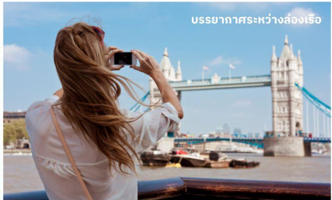
บรรยากาศระหว่างล่องเรือ

ชมทิวทัศน์งดงามของสองฝากฝั่งแม่น้ำเทมส์ ซึ่งไหลผ่านกลางกรุงลอนดอน ล่องเรือผ่านสถานที่สำคัญต่างๆ เช่น จัตุรัสรัฐสภา, พระราชวังเวสต์มินสเตอร์, ลอนดอนอาย, ทาวเวอร์ออฟลอนดอน และ ทาวเวอร์บริดจ์