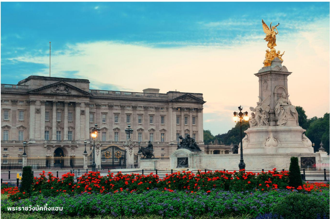
พระราชวังบักกิงแฮม