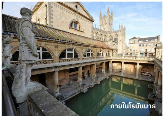
ภายในโรมันบาร