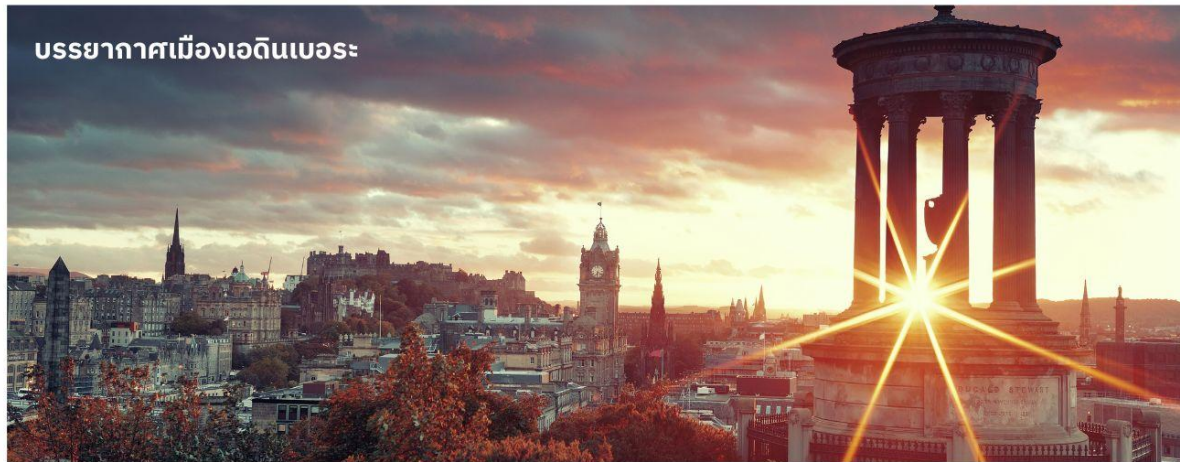
บรรยากาศเมืองเอ็ดินเบอระ

e-mail: tour.aaj@gmail.com , Web Site: www.allabout-journey.com