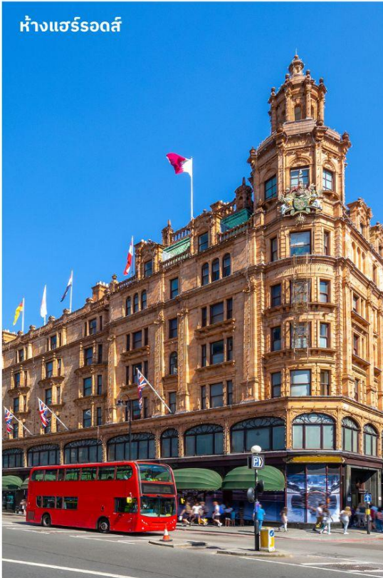
ห้างแฮร์รอดส์

e-mail: tour.aaj@gmail.com , Web Site: www.allabout-journey.com