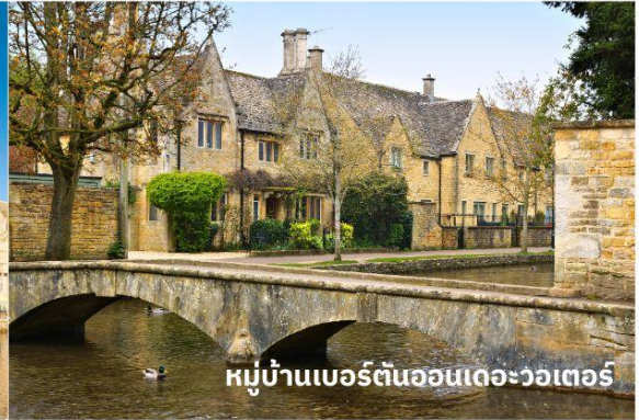
หมู่บ้านเบอร์ตันออนเดอะวอเตอร์