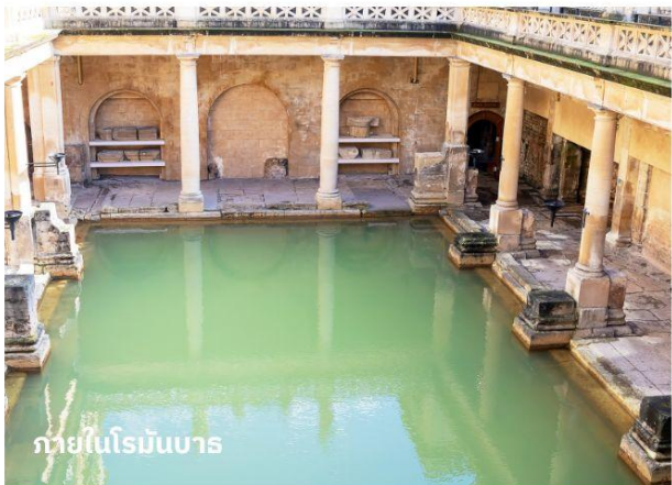
ภายในโรมันบาร