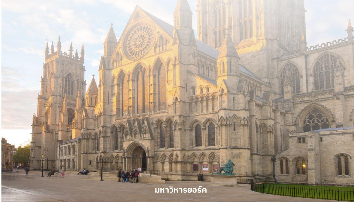
มหาวิหารยอร์ก

จากนั้นนำท่านเดินต่อไปที่ The Shambles (เดอะแชมเบิล) เป็นสถานที่ที่มีความคล้ายกับตรอกไดอากอนในภาพยนตร์ชื่อดังอย่าง Harry Potter อีสาระให้ท่านเดินเลือกซื้อของที่ระลึกตามอัธยาศัย