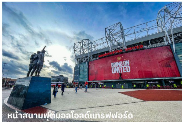
หน้าสนามฟุตบอลโอลด์แทรฟฟอร์ด