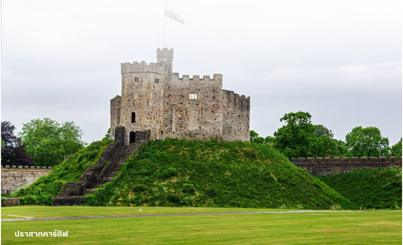
ปราสาทคาร์ดิฟฟ์

บริการอาหารค่ำ ณ ภัตตาคาร นำท่านเข้าสู่ที่พัก Clayton Hotel Cardiff หรือเทียบเท่า