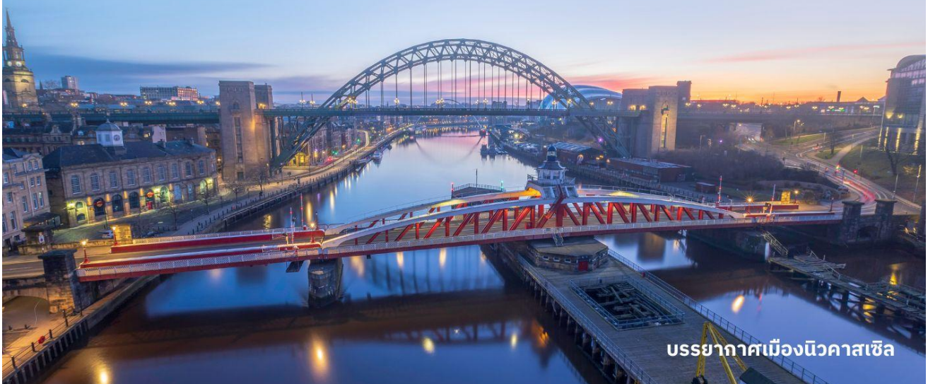
บรรยากาศเมืองนิวคาสเซิล

บริการอาหารค่ำ ณ ภัตตาคาร นำท่านเข้าสู่ที่พัก Leonardo Hotel Newcastle หรือเทียบเท่า