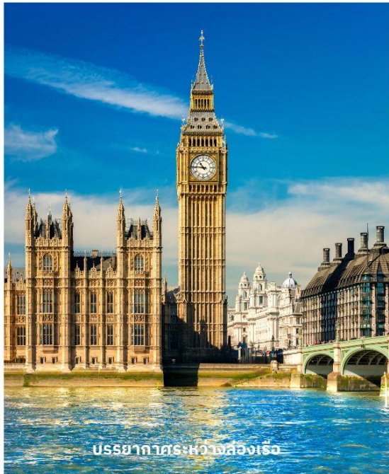
บรรยากาศระหว่างล่องเรือ

จากนั้นนำท่านผ่านชม พระราชวังบักกิงแฮม ก่อนนำท่านเก็บภาพสวยๆที่ หอนวมฟากบิกเบน สัญลักษณ์ที่สำคัญของลอนดอนที่ตั้งอยู่เคียงข้างอาคารรัฐสภาที่สวยงามริมฝั่งแม่น้ำเทมส์ จากนั้นผ่านชมสถานที่สำคัญต่างๆ อาทิ บ้านเลขที่ 10, ถนนดาวนนิ่งทำเนียบนายกรัฐมนตรี, จัตุรัสทราฟัลการ์, อนุสรณ์แห่งสงครามทราฟัลการ์ของท่านลอร์ดเนลสัน, พิคคาเดิลลี เซอร์คัส, ย่านโซโฮ ฯลฯ