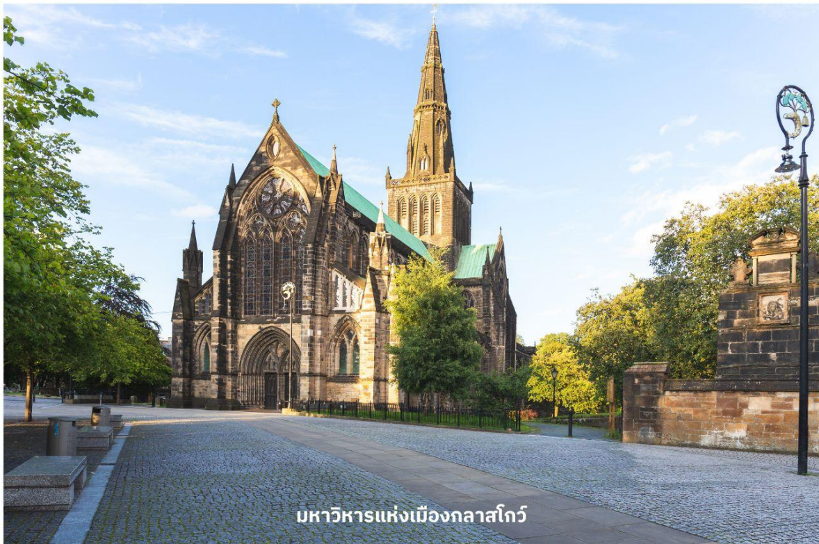
มหาวิหารแห่งเมืองกลาสโกว์