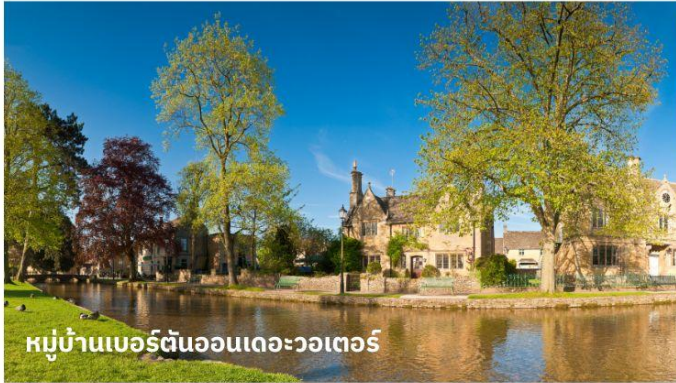
หมู่บ้านเบอร์ตันออนเดอะวอเตอร์