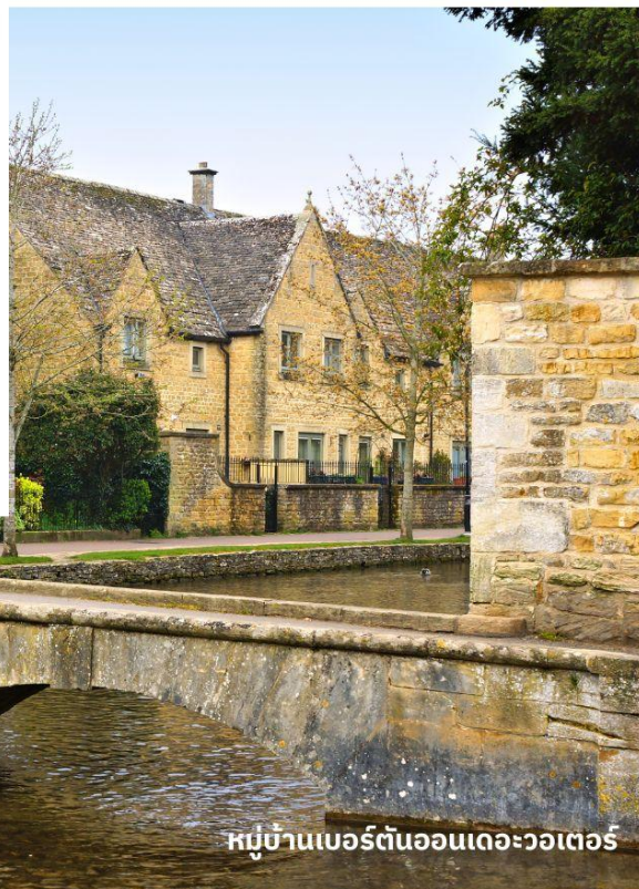
หมู่บ้านเบอร์ตันออนเดอะวอเตอร์

จากนั้นนำท่านเดินทางสู่ เขตคอตส์วอลส์ เขตหมู่บ้านชนบทแสนสวยของอังกฤษถึง 70 หมู่บ้าน ใช้เวลาเดินทางประมาณ 3.30 ชั่วโมง นำท่านเที่ยวชม หมู่บ้านเบอร์ตันออนเดอะวอเตอร์ (Bourton On The Water) หมู่บ้านเล็ก ๆ ที่รู้จักกันในนามของ “เวนิส แห่งคอตวอลส์” เมืองที่โด่งดังที่สุดในคอตส์วอลส์ ดูเจียบสงบมีลำธารสายเล็ก ๆ (แม่น้ำวินด์ริช) ไหลผ่านกลางเมือง และมีสะพานหินทอดข้ามน้ำเป็นช่วง ๆ กับต้นวิลโลว์ที่แกว่งกิ่งก้านใบอยู่ริมน้ำ