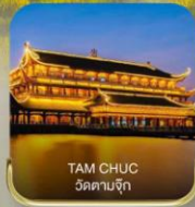
TAM CHUC วัดตามจุก