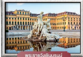
พระราชวังเชินบรุนน์