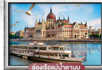
ล่องเรือแม่น้ำดานูบ

พิเศษ!! ลิ้มลองเมนูประจำชาติ ทั้ง 5 ประเทศ!!!