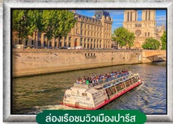
ล่องเรือชมวิวเมืองปารีส