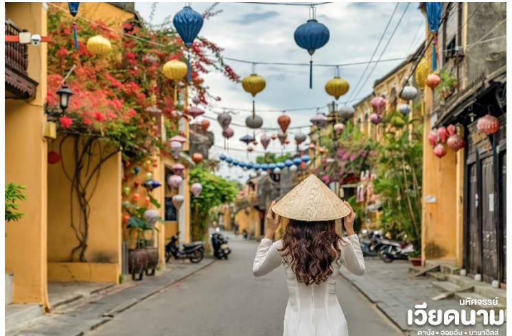
บริษัทจรรยา เวียดนาม ดานัง • ฮอยอัน • ฮานอย

เมืองฮอยอันนั้นอดีตเคยเป็นเมืองท่าการค้าที่สำคัญแห่งหนึ่งในเอเชียตะวันออกเฉียงใต้และเป็นศูนย์กลางของการแลกเปลี่ยนวัฒนธรรมระหว่างตะวันตกกับตะวันออกองค์การยูเนสโกได้ประกาศให้ฮอยอันเป็นเมืองมรดกโลกทางวัฒนธรรมเนื่องจากเป็นสถานที่สำคัญทางประวัติศาสตร์ แม้ว่า จะผ่านการบูรณะขึ้นเรื่อยๆแต่ก็ยังคงรูปแบบของเมืองฮอยอันไว้ได้