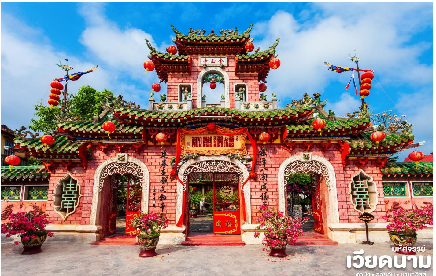
บริษัทจรรยา เวียดนาม ดานัง • ฮอยอัน • ฮานอย

เป็นสมาคมชาวจีนที่ใหญ่และเก่าแก่ที่สุดของเมืองฮอยอันใช้เป็นที่พักปะของคนหลายรุ่น วัดนี้มีจุดเด่นอยู่ทำงานไม้แกะสลักลวดลายสวยงามท่าน สามารถทำบุญต่ออายุโดยพิธีสมัยโบราณ คือ การนำรูปที่ขีดเป็นกันหอย มาจุดทิ้งไว้เพื่อ เป็นสิริมงคลแก่ท่าน