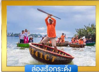
ล่องเรือกระดัง