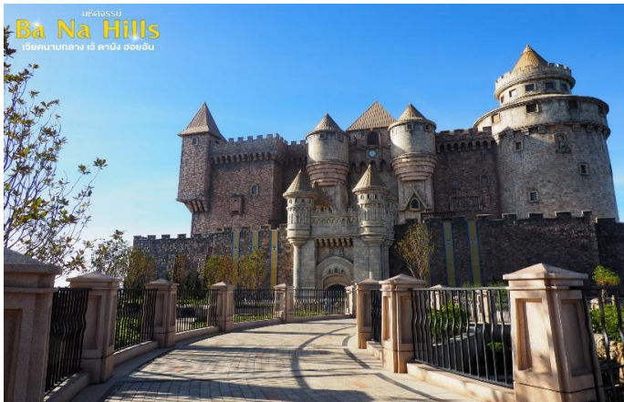
มัทศจรรย์ Ba Na Hills เวียดนามกลาง เว้ ดานัง ฮอยอัน