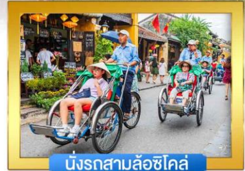
นั่งรถสามล้อชิโคล์