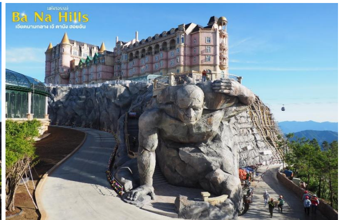
มัทศจรรย์ Ba Na Hills เวียดนามกลาง เว้ ดานัง ฮอยอัน