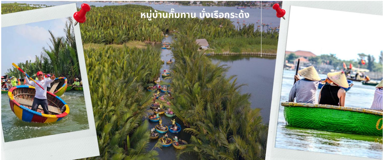
หมู่บ้านก๊ีบทาน บั้งเรือกระด้ง

จากนั้นนำท่านเดินทางสู่ เมืองโบราณฮอยอัน เทียบชมเมืองมรดกโลกทางวัฒนธรรมได้รับการขึ้นทะเบียนจาก UNESCO มนต์เสน่ห์อยู่ที่บ้านโบราณซึ่งอายุเก่าแก่กว่า 200 ปี มีหลังคา ทรงกระดองปูแบบเฉพาะของเมืองฮอยอัน ซึ่งเป็น สถาปัตยกรรมที่ไม่ซ้ำแบบทั้งในด้านศิลปะและการแกะสลัก ชมย่านการค้าเมืองท่าค้าขายสมัยโบราณของชาวจีน **เมืองฮอยอัน ไม่อนุญาตให้นำรถใหญ่เข้าไป ดังนั้นการเดินทางชมเมืองจึงเป็นวิธีท่องเที่ยวที่ดีที่สุด** นำท่านชม สะพานญี่ปุ่น ซึ่งเป็น พิพิธภัณฑ์ประวัติศาสตร์วัดกวนอู ศาลเจ้า ชุมชนชาวจีน และ บ้านโบราณ อายุยาวนานกว่า200ปีซึ่งสร้างในแบบผสมผสานสถาปัตยกรรมของยุคศตวรรษที่17