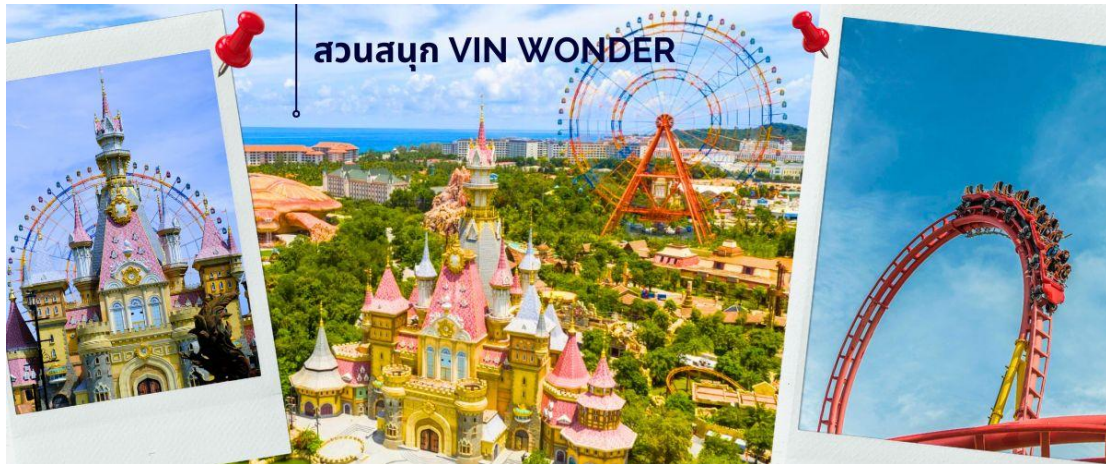
สวนสนุก VIN WONDER