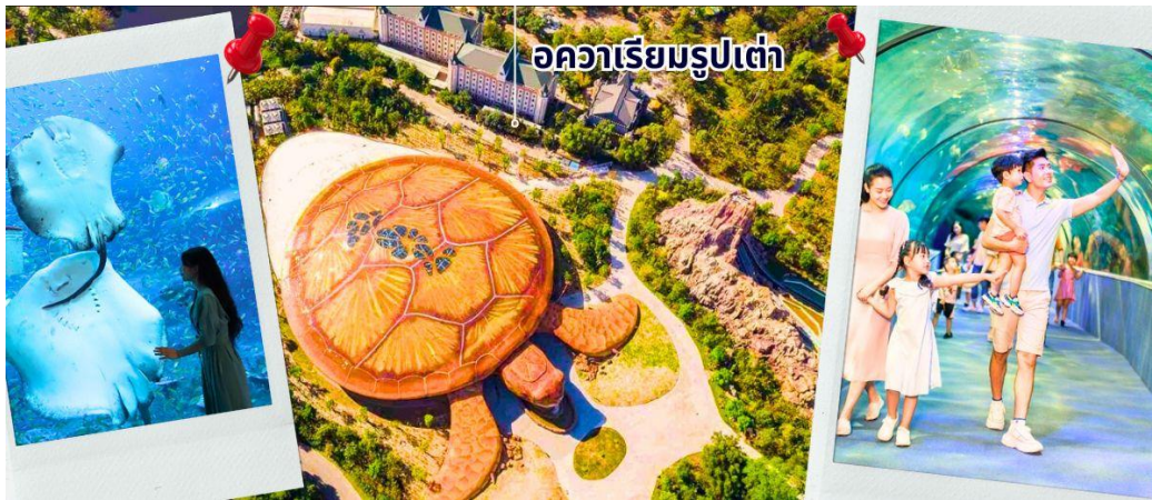
อควาเรียมรูปเต่า

ไม่พลาดที่จะพาท่านพบกับความตื่นตาตื่นใจไปกับ ความมหัศจรรย์ของโลกใต้ท้องทะเลที่น่าหลงใหล และจะทำให้ท่านประทับใจไปกับความสวยงามของสัตว์น้ำนานาชนิด อควาเรียมรูปเต่า ถือเป็นศูนย์จัดแสดงพันธุ์สัตว์น้ำ ที่สมบูรณ์แบบ และใหญ่ที่สุดของประเทศเวียดนาม ด้วยรูปทรงอาคาร รูปทรงเต่าทะเลขนาดใหญ่ตั้งเด่นอยู่กลางแจ้งภายในสวนสนุก VIN WONDERS โดยมีแรงบันดาลใจจากเต่าในตำนานวัฒนธรรมดั้งเดิมของชาวเวียดนาม มีพื้นที่จัดแสดงพันธุ์สัตว์น้ำ กว่าสามแสนตารางฟุต มีสัตว์น้ำมากกว่า 300 สายพันธุ์ รวมทั้งนกเพนกวิน ที่พร้อมอวดความน่ารักสดใส และคอยออกมาทักทายต้อนรับนักท่องเที่ยวที่มาเยี่ยมชมภายใน อควาเรียมแห่งนี้