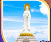
สวน พุทธธรรมหนานซาน เจ้าแม่กวนอิม