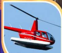
ขึ้นเฮลิคอปเตอร์ ชมวิว 360 องศา