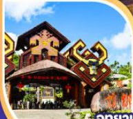
อุทยาน วัดวัฒนธรรมเผ่าแม้ว-หลี กิจกรรมรอบกองไฟ