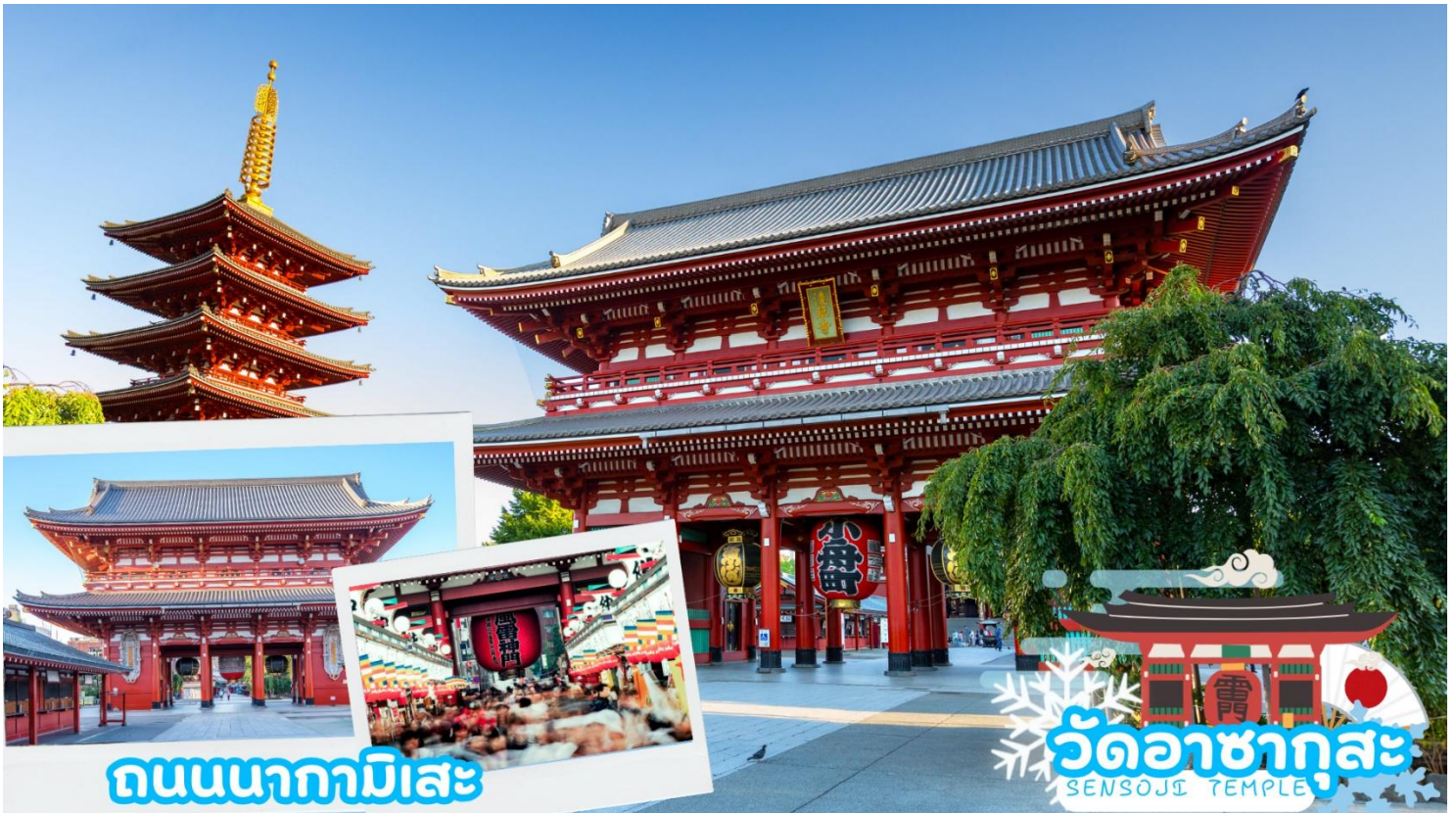
ถนนนากามิสะ