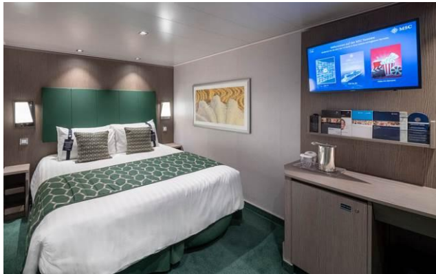
เส้นทางเดินเรือ MSC SEAVIEW