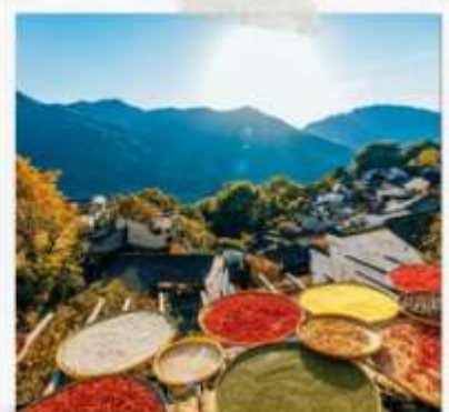
หมู่บ้านหวงลิ่ง