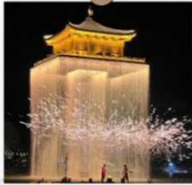
แสงไฟอุ๊นวิโจว