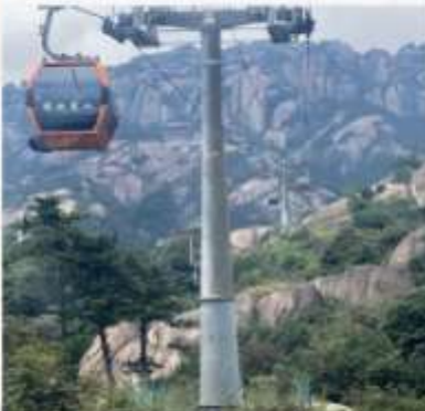
เขาลิ่งซาน