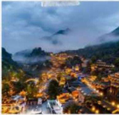
หุบเขาวังเซียนกู่