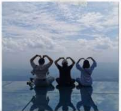
กระจกแห่งท้องฟ้า