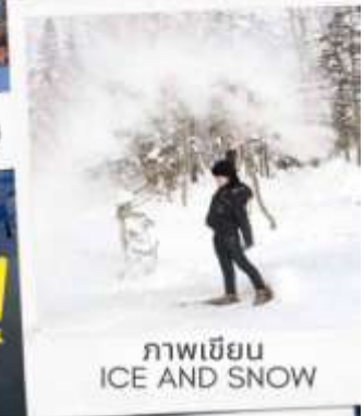
ภาพเขียน ICE AND SNOW