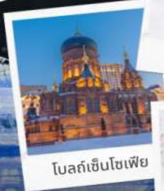
โบสถ์เซินโซเฟีย