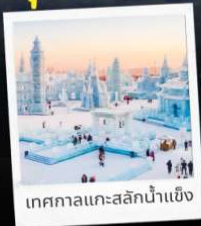
เทศกาลแกะสลักน้ำแข็ง