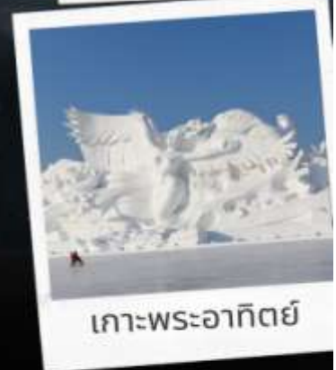
แกะพระอาทิตย์