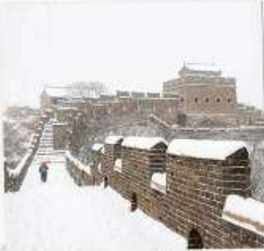
กำแพงเมืองจีน ด่านจวิหยงกวน