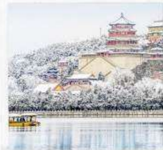
พระราชวังฤดูร้อน อวิเหอหยวน