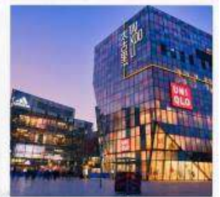
ซานหลี่ถุน