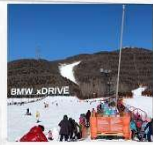
เล่นสกีจิวินตูซาน