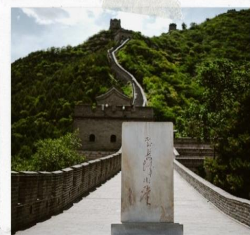
กำแพงเมืองจีน ด่านจวิหยงกวน