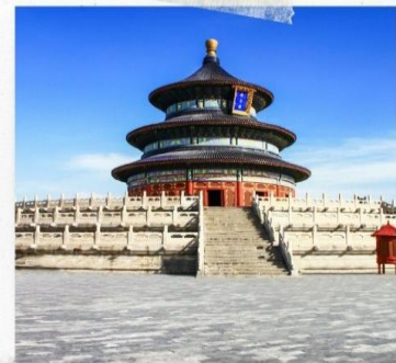
หอบูชาเทียนถาน