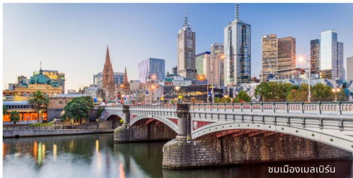
ชมเมืองเมลเบิร์น