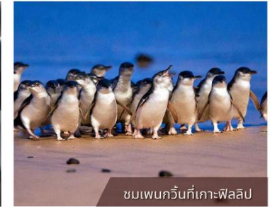
ชมเพนกวินที่เกาะฟิลลิป