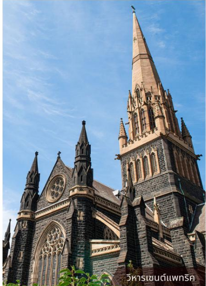
วิหารเซนต์แพทริก