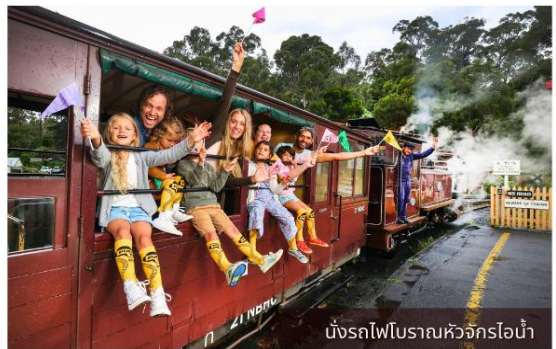
นั่งรถไฟโบราณหัวจักรไอน้ำ