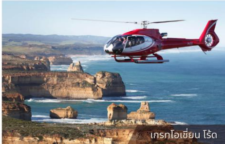
เฮลิคอปเตอร์ขึ้น ไรต์