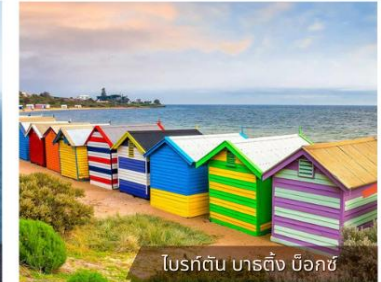
โบสถ์ต้น บาร์ติง นีอกซ์