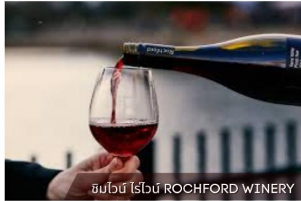
ชิมไวน์ โรโรน Rochford Winery