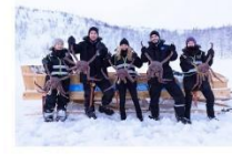
สนุกกับกิจกรรมจับปุยักษ์

00.00 น. ออกเดินทางสู่ เมืองคีร์กเคนเนส โดยสายการบิน...เที่ยวบินที่... 00.00 น. เดินทางถึงสนามบินเมืองคีร์กเคนเนส