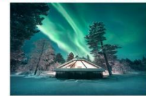
Glass Igloo Hotel

** พักที่ NORTHERN LIGHTS VILLAGE OR SIMILAR **