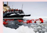
ล่องเรือตัดน้ำแข็ง Ice Breaker