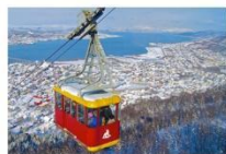
Tromso Cable Car

** ที่พัก CLARION HOTEL THE EDGE OR SIMILAR **