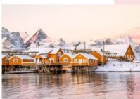
หมู่บ้าน Sakrisoy