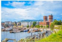
เมืองออสโล

06.10 น. เดินทางถึงนครอัสตันบูล ประเทศตุรกี (แวะเปลี่ยนเครื่อง) 09.00 น. ออกเดินทางสู่กรุงออสโล ประเทศนอร์เวย์ เที่ยวบินที่ TK 1751 11.00 น. เดินทางถึงสนามบินนานาชาติเมืองออสโล