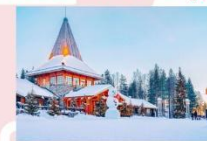
หมู่บ้านซานต้าครอส

15.25 น. ออกเดินทางสู่อัสตันบูล ประเทศตุรกี เที่ยวบินที่ TK 1750