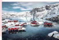
หมู่บ้าน Nusfjord

** พักที่ ELIASSEN RORBUER OR SIMILAR **