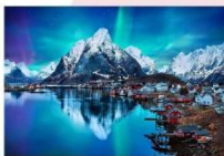
หมู่เกาะโลโฟเทน

00.00 น. ออกเดินทางสู่ เมืองเลกเนส โดยสายการบิน Scandinavian Airlines เที่ยวบินที่ SK 4106 แวะเปลี่ยนเครื่องที่เมือง Bodo เป็นสายการบิน Wide roe WF 810 00.00 น. เดินทางถึงสนามบินเมืองเลกเนส