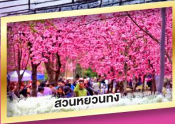
สวนหยวงทง