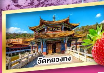
วัดหยวงทง