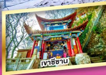
เวาชีซาน