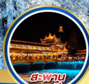
สะพาน หนานเจียว