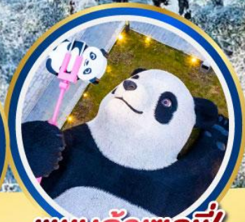
แพนด้าเซลฟ์