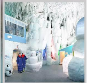
"KAMIKAWA ICE PAVILLION"