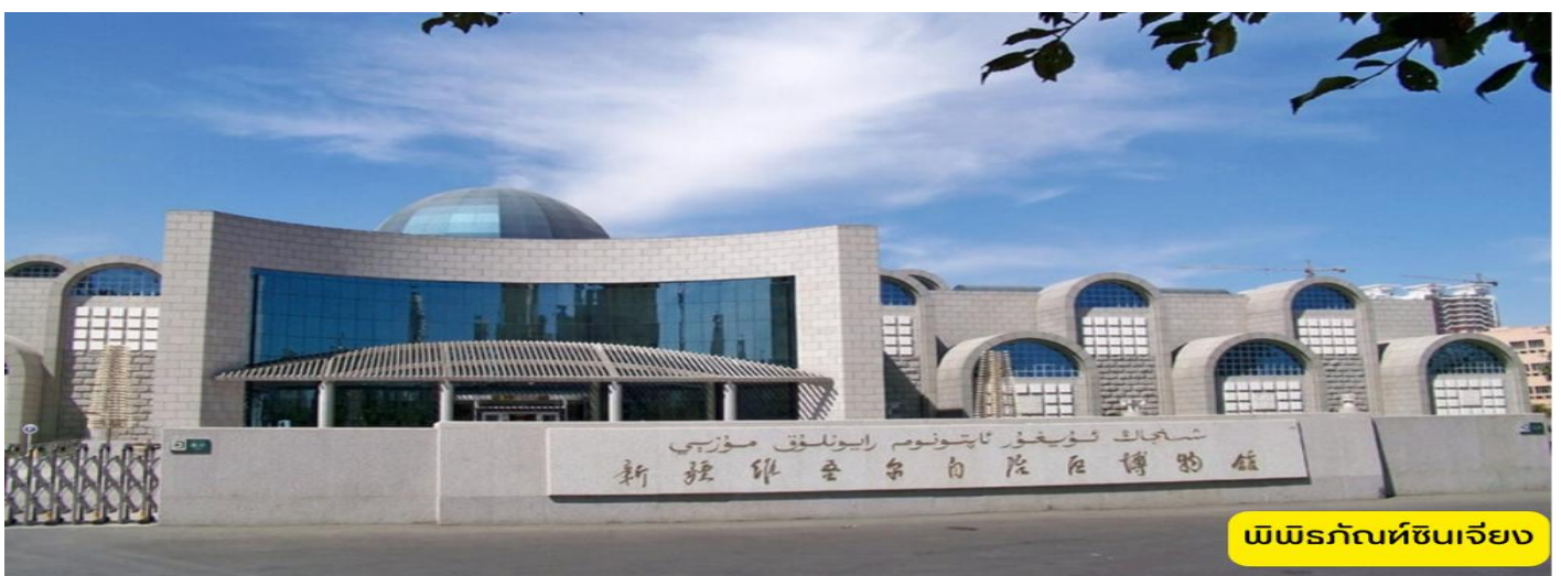
พิพิธภัณฑ์ซินเจียง

สวนหงซาน - พิพิธภัณฑ์ซินเจียง - อุรุมูฉี - บินภายใน - หลานโจว