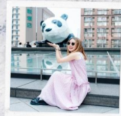
IFS แพนด้าปิงตึก