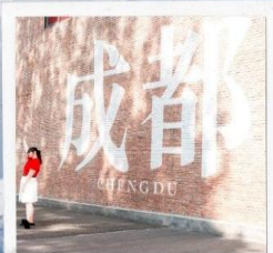
CHENGDU EASTERN MEMORY