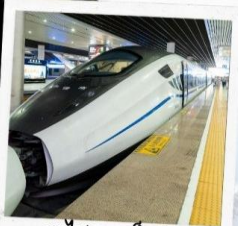
รถไฟความเร็วสูง สู่จี้จ้ายโกว