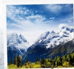
ภูเขาหิมะการ์เซีย ต้ากู่ปิงชวง