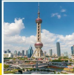
ชั้นชมหอไข่มุก