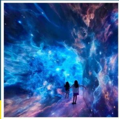
SPACE & TIME CUBE