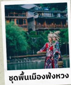
ชุดพื้นเมืองฟ่งหวง