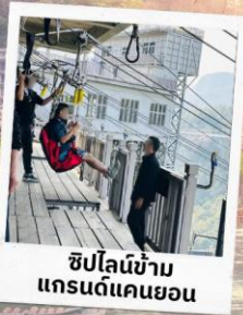
ซิปไลน์ข้าม แกรนด์แคนยอน