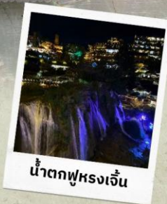
น้ำตกฟูหลงเจิ้น