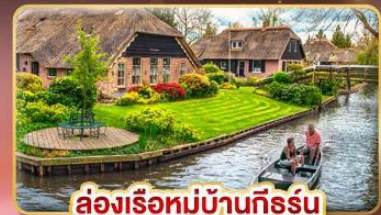
ล่องเรือหมู่บ้านกังหัน