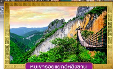
หุบเขารอยแยกอู่หลิงซาน