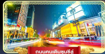
ถนนคนเดินชุนชิว