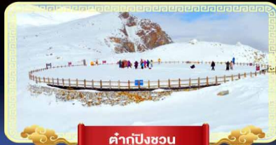
ต้ากู่ปิงชว่น