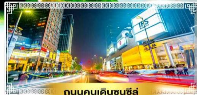
ถนนคนเดินชุนซีลู่