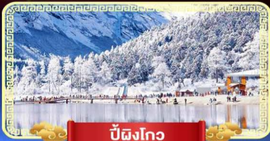
ปี้ผิงโกว

สัมปัสสวรรค์บนดินแห่งเมืองจีน เที่ยวสุดคุ้ม 3 อุทยานทางธรรมชาติ