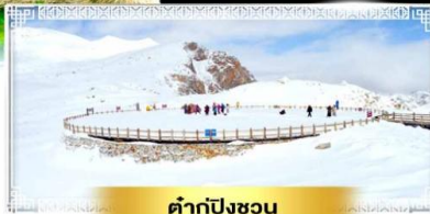
คำกู่ปิงชว