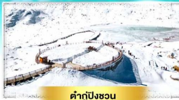
คำกู่ปิงชว