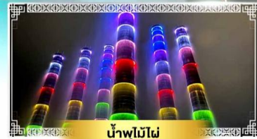
น้ำพุไม้ไผ่