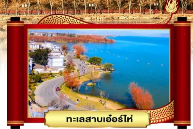
ทะเลสาบเอ๋อร์ไห่