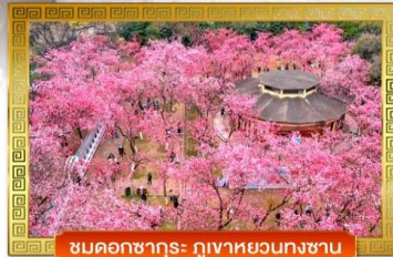
ชมดอกซากุระ ภูเขาหยวนทงซาน