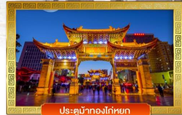
ประตูน้ำทองโก่หยก