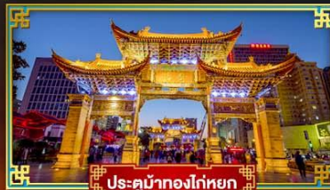
ประตูน้ำทองโก่หยก