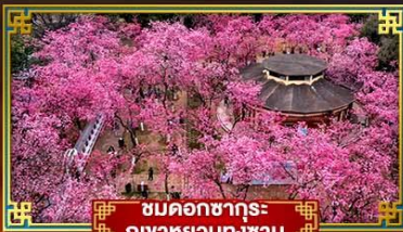
ชมดอกซากุระ ภูเขาหยวนกงซาน