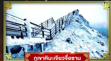
ภูเขาหิมะเจียวจื่อซาน