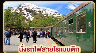
นั่งรถไฟสายโรแมนติก “พร้อมสปา”