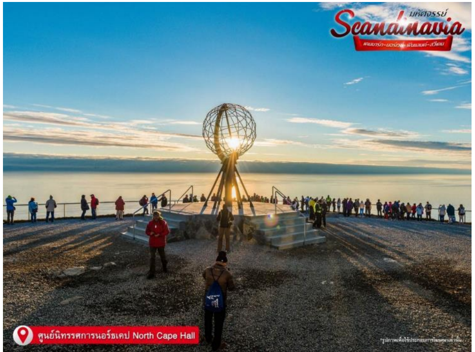
ศูนย์นิทรรศการนอร์แคป North Cape Hall

รูปถ่ายเพื่อใช้ประกอบเอกสารประชาสัมพันธ์