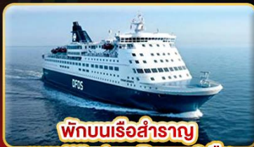
พักผ่อนเรือสำราญ แบบ Window Room 2 คืน