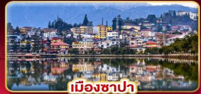
เมืองซาปา