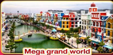
Mega grand world