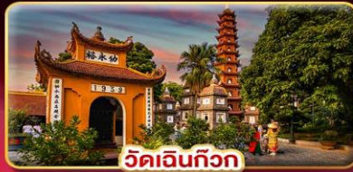
วัดเงินทิว