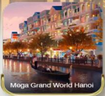
Mega Grand World Hanoi