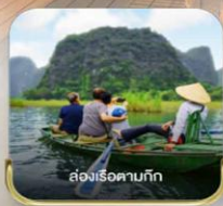
ล่องเรือตามกัก