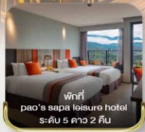
พักที่ paos sapa leisure hotel ระดับ 5 ดาว 2 คืน