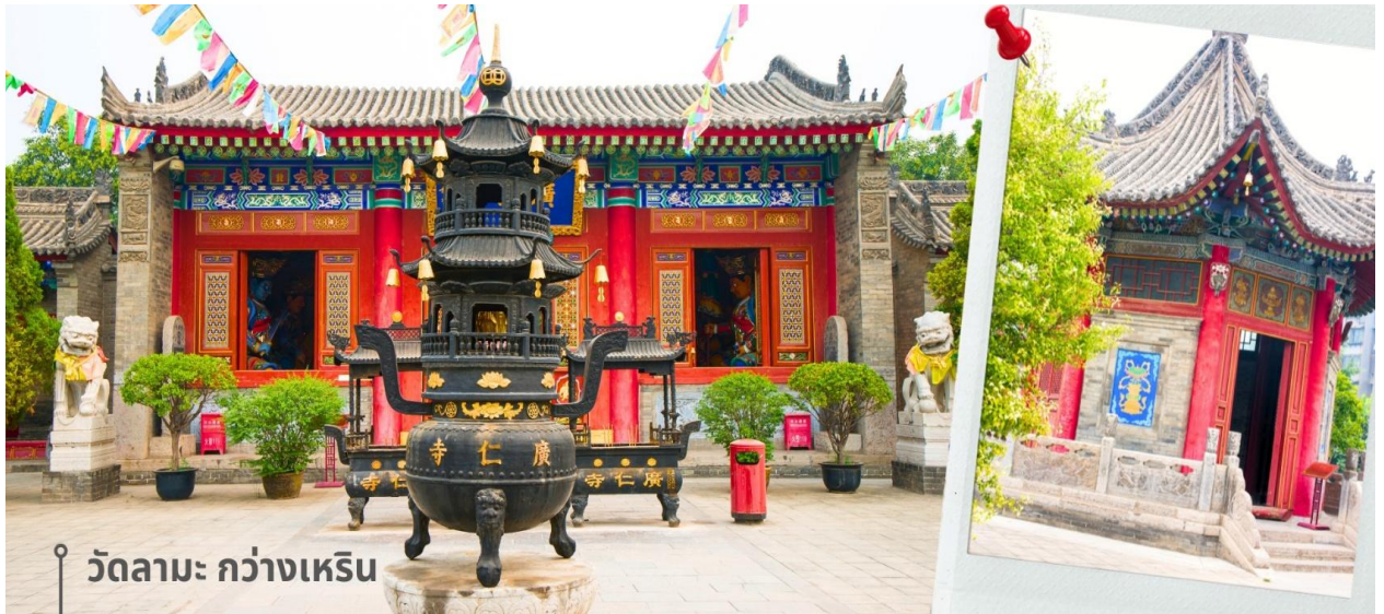
วัดลามะ กว่างเหิน

จากนั้นเดินทางต่อไปยัง วัดลามะกรุงเหิน เป็นวัดลามะแห่งเดียวในซีอาน สร้างขึ้นในปี ค.ศ.1705 ช่วงราชวงศ์ชิง เพื่อรองรับลามะจากทิเบตที่เดินทางมาพักแรมและประกอบพิธีกรรมทางศาสนา จุดเด่นของวัดคือสถาปัตยกรรมที่ผสมผสานสไตล์จีนและทิเบตอย่างงดงาม ภายในมีพระพุทธรูปและภาพจิตรกรรมฝาผนังที่วิจิตร รวมถึง "หอสมุดทิเบต" ซึ่งรวบรวมตำราทางพุทธศาสนาแบบทิเบตไว้ นักท่องเที่ยวสามารถสัมผัสบรรยากาศที่เงียบสงบและเรียนรู้เกี่ยวกับวัฒนธรรมทิเบตได้ที่นี้