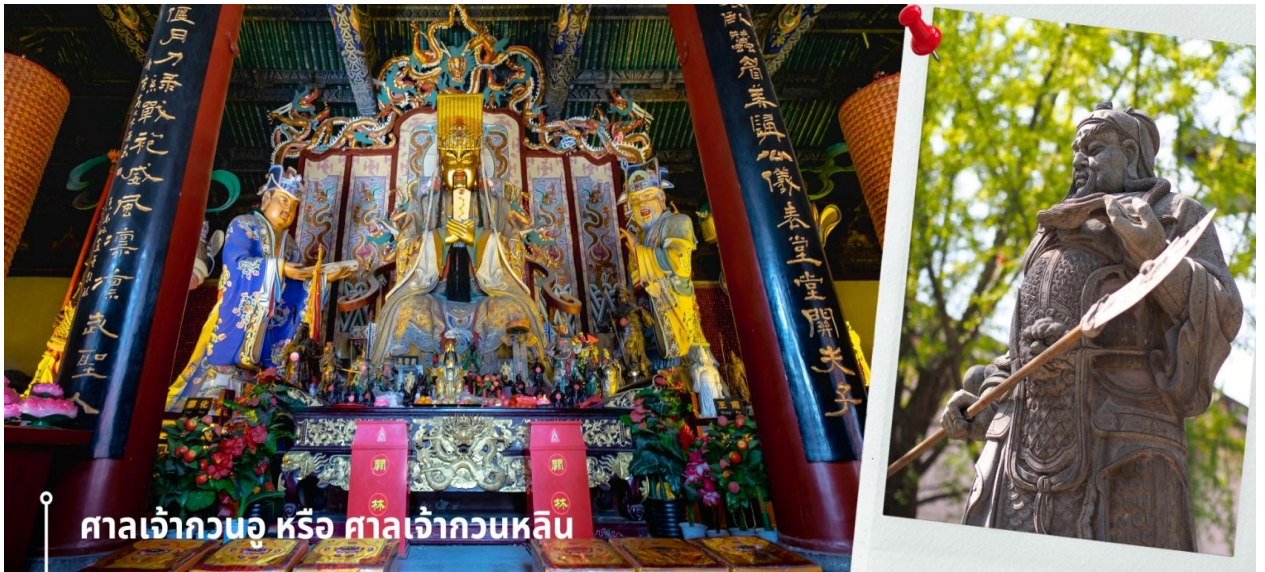
ศาลเจ้ากวนอู หรือ ศาลเจ้ากวนลัน

นำท่านเที่ยวชม เมืองโบราณลั่วอี้ เป็นสถานที่ท่องเที่ยวระดับ 1A ตั้งอยู่ในเมืองเก่าของเมืองลั่วหยาง เมืองหลวงโบราณของราชวงศ์ทั้ง 13 ราชวงศ์ บรรยากาศอบอวลไปด้วยเสน่ห์แบบจีนโบราณ ที่ยังคงอยู่มา ยาวนานหลายร้อยปี เมื่อเดินเล่นผ่านเมืองโบราณลั่วอี้ จะเห็นสถาปัตยกรรมบ้านเรือน ที่มีชายคาซ้อนกัน เป็นชั้นๆ และกำแพงเมือง สนามหญ้าโบราณ ให้ทุกท่านรู้สึกราวกับหลุดเข้าไปในยุคจีน โบราณ