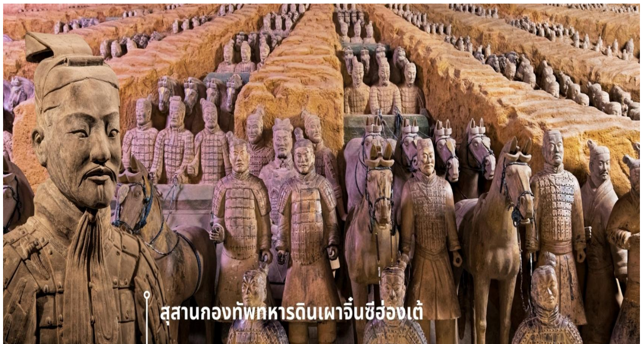
สุสานกองทัพทหารดินเผาจีนซีฮ่องเต้

สุสานและกองทัพทหารดินเผาแห่งนี้จึงเปรียบเสมือนการสะท้อนอำนาจของพระองค์ในยุคที่ยังมีชีวิต รวมถึงเป็นสัญลักษณ์แห่งความทะเยอทะยานของพระองค์ที่ไม่สิ้นสุดแม้ในความตาย สุสานกองทัพทหารดินเผาถูกค้นพบในปี ค.ศ. 1974 โดยชาวนาที่ขุดบ่อน้ำในเขตซีอาน มณฑลส่านซี หลังการค้นพบครั้งนั้น การขุดค้นและวิจัยทางโบราณคดีก็เริ่มต้นขึ้น ซึ่งทั้งหมดถูกจัดเรียงอย่างเป็นระเบียบในพื้นที่สุสานขนาดใหญ่ ภายในใช้เป็นสถานที่บรรจุพระบรมศพจีนซีฮ่องเต้ รวมไปถึงกองทัพทหารดินเผามีจำนวนมากกว่า 8,000 ตัว แต่ละตัวมีขนาดเท่าคนจริง และยังมีม้าดินเผาอีกกว่า 600 ตัว พร้อมรถม้า และอาวุธต่าง ๆ ความน่าทึ่งอีกอย่างก็คือ ทหารดินเผาแต่ละตัวถูกปั้นขึ้นด้วยมือและมีรายละเอียดแตกต่างกันไป เช่น สีหน้า ทรงผม และเครื่องแต่งกาย ซึ่งสะท้อนยศและบทบาทของแต่ละคนในกองทัพ รวมถึงการเคลือบสีเพื่อให้รูปปั้นคงทนยาวนาน ซึ่งในปัจจุบัน สุสานแห่งที่มีขนาดใหญ่ พื้นที่มากกว่า 56 ตารางกิโลเมตร ยังมีหลุมฝังศพหลัก และหลุมย่อยอีกมากมายที่ยังไม่ได้ถูกขุดค้น