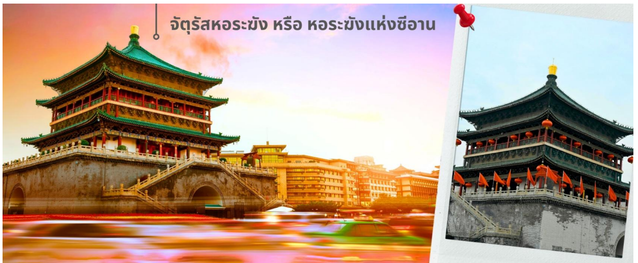
จัตุรัสหอร่ซัง หรือ หอร่ซังแห่งซีอาน

จากนั้นนำท่านเดินทางเที่ยวชม จัตุรัสหอร่ซัง หรือ หอร่ซังแห่งซีอาน เป็นหนึ่งในสัญลักษณ์สำคัญของเมืองซีอาน ตั้งอยู่ใจกลางเมือง สร้างขึ้นในปี ค.ศ. 1384 สมัยราชวงศ์หมิง เพื่อใช้ประกาศเวลาและเตือนภัยจากศัตรู ตัวหอสร้างจากไม้ทั้งหมด มีความสูงประมาณ 36 เมตร โดดเด่นด้วยสถาปัตยกรรมจีนโบราณทั้งงดงาม และการประดับด้วยลวดลายสีทองและเขียว จัตุรัสแห่งนี้เป็นจุดตัดของถนนสายหลักทั้งสี่สาย สามารถขึ้นไปชมวิวเมืองซีอานแบบพาโนรามาได้ด้านบน นอกจากนี้ ภายในยังมีพิพิธภัณฑ์เกี่ยวกับประวัติศาสตร์และวัฒนธรรมของหอร่ซังให้ได้ชมอีกด้วย