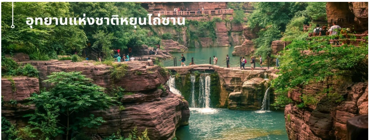
อุทยานแห่งชาติหุบไถ่ซาบ