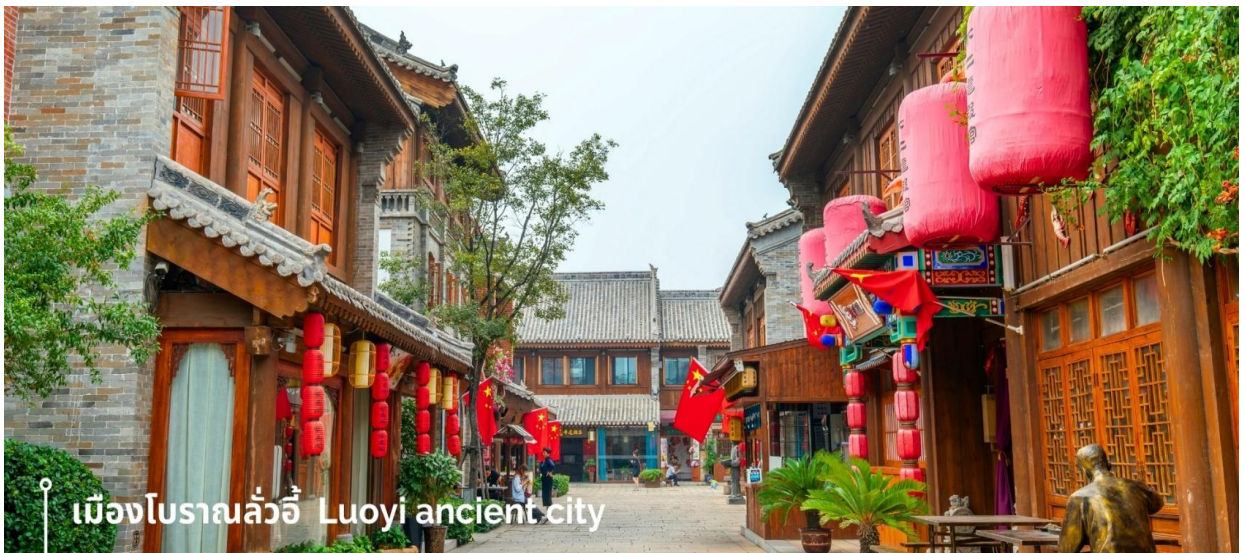
เมืองโบราณลั่วอี้ Luoyi ancient city

นำท่านเที่ยวชม เมืองโบราณลั่วอี้ เป็นสถานที่ท่องเที่ยวระดับ 1A ตั้งอยู่ในเมืองเก่าของเมืองลั่วหยาง เมืองหลวงโบราณของราชวงศ์ทั้ง 13 ราชวงศ์ บรรยากาศอบอวลไปด้วยเสน่ห์แบบจีนโบราณ ที่ยังคงอยู่มา ยาวนานหลายร้อยปี เมื่อเดินเล่นผ่านเมืองโบราณลั่วอี้ จะเห็นสถาปัตยกรรมบ้านเรือน ที่มีชายคาซ้อนกัน เป็นชั้นๆ และกำแพงเมือง สนามหญ้าโบราณ ให้ทุกท่านรู้สึกราวกับหลุดเข้าไปในยุคจีน โบราณ