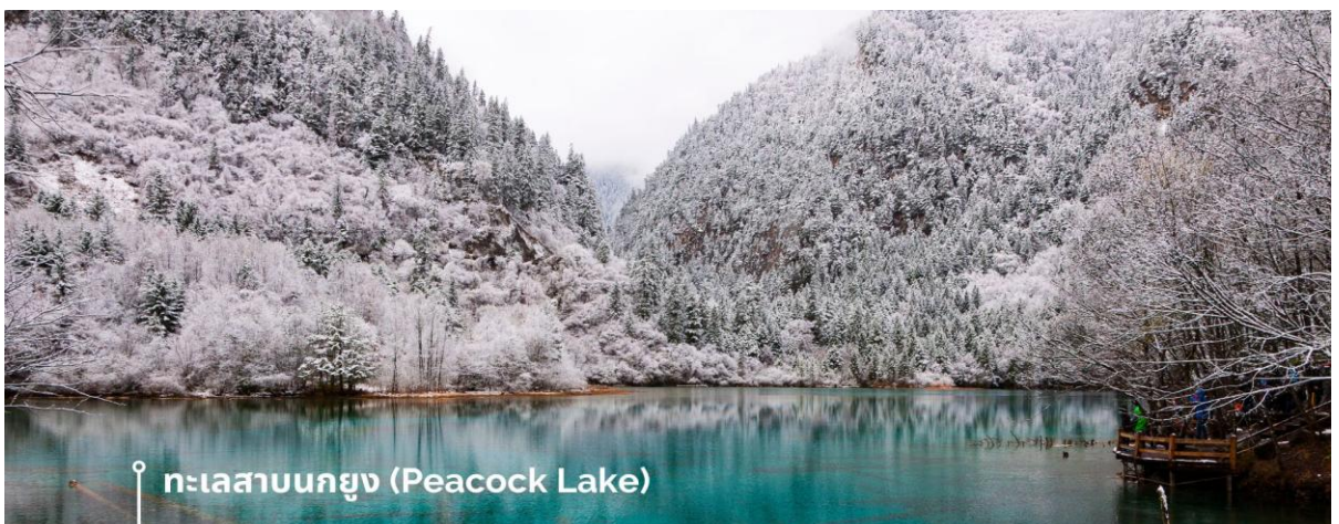
ทะเลสาบนกยูง (Peacock Lake)

ทะเลสาบมีรูปร่างคล้ายกับนกยูง จึงเป็นที่มาของชื่อ แม้พื้นที่จะไม่กว้างมากนัก มีความยาวเพียงแค่ 310 เมตร แต่ความสวยงามของที่นี่ก็ไม่แพ้จุดอื่นๆ ของอุทยานฯ เพราะน้ำในทะเลสาบเป็นสีฟ้าใสราวกับคริสตัล ไล่เฉดฟ้าอ่อน ฟ้าอมเขียว และน้ำเงินตามความตื้นลึกของน้ำ ในช่วงฤดูหนาวต้นไม้จะถูกปกคลุมไปด้วยหิมะสีขาวนวล ดูแล้วคล้ายนกยูงกำลังจ้ำจี้สี หากมาในช่วงที่มีแสงแดดจะมองเห็นความงดงามได้ทั่วบริเวณ