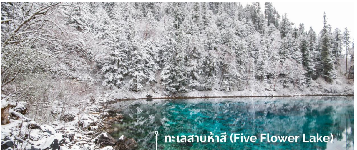
ทะเลสาบห้าสี (Five Flower Lake)

หนึ่งในจุดที่สวยงามและนักท่องเที่ยวแวะมาเยี่ยมชมเยอะที่สุด ตั้งอยู่ที่ความสูงเหนือระดับน้ำทะเลประมาณ 2,472 เมตร น้ำลึกประมาณ 5 เมตร น้ำใสจนเห็นพื้นด้านล่างของทะเลสาบ สีของผิวน้ำสวยงามแปลกตา โดยเฉพาะเมื่อยามแสงอาทิตย์สาดส่องกระทบผิวน้ำ สีของน้ำในทะเลสาบจะสะท้อนเป็นสีส้มถึง 5 เฉดสี สวยงามสะกดตา ซึ่งสาเหตุที่ทำให้เกิดสีส้มต่างๆ นี้มาจากการสะสมของแร่ธาตุและพืชน้ำชนิดต่างๆ โดยจะมีสีส้มแตกต่างกันไปตามฤดูกาลและช่วงเวลา ยิ่งถ้ามาในช่วงฤดูหนาว ต้นไม้ริมทะเลสาบจะเต็มไปด้วยหิมะสีขาวตัดกับสีของทะเลสาบ ดูสวยงามแปลกตา