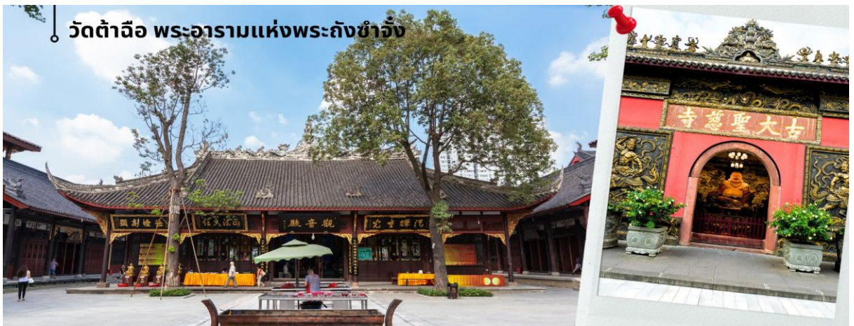
วัดต้าฉือ พระอารามแห่งพระถังซำจั๋ง

นำท่านชม วัดต้าฉือ พระอารามแห่งพระถังซำจั๋ง ใจกลางนครเฉิงตู พระถังซำจั๋ง ได้รับการสรรเสริญว่าเป็นผู้มีความเพียร และมีชื่อเสียงมายาวนานกว่า 1,400 ปี และยังได้รับการยกย่องว่าเป็น พระไตรปิฎกแห่งราชวงศ์ถัง พุทธประวัติของพระถังซำจั๋งถูกจารึกในสถานที่ต่างๆมากมาย รวมไปถึงได้ถูกกล่าวถึงในจดหมายเหตุหลายเล่ม ตามเส้นทางการเดินทางแห่งความเพียรของท่าน รวมทั้งมีพระอัฐิของท่านประดิษฐานอยู่ในพระอารามของนครนานจิง และที่ทะเลสาบสุริยันจันทราเป็นเกาะได้หัววันอีกด้วย