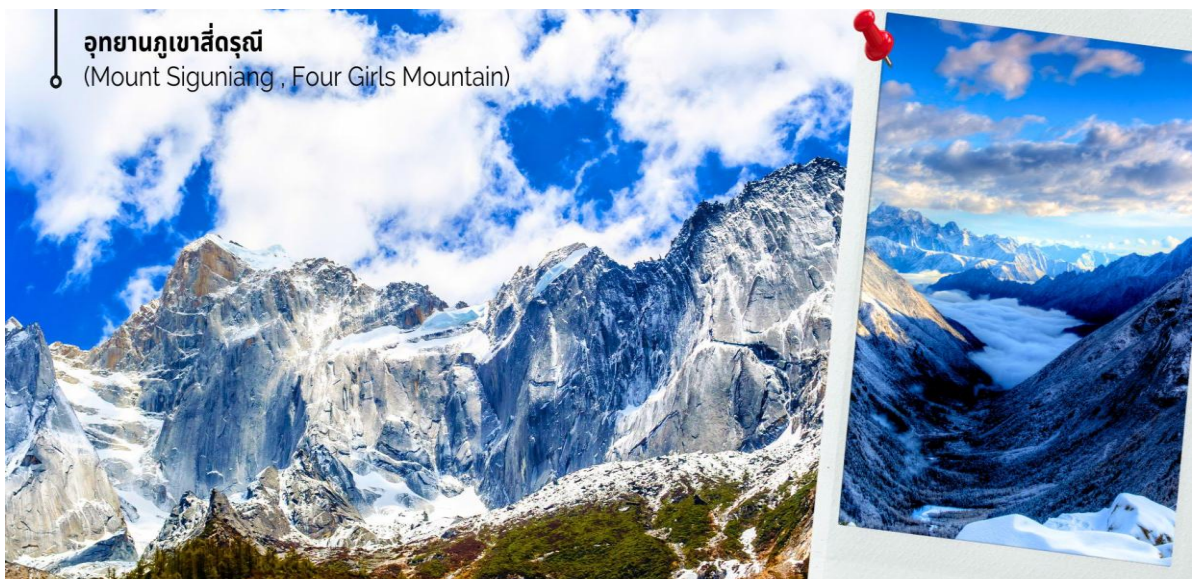
อุทยานภูเขาสี่ดรุณี (Mount Siguniang , Four Girls Mountain)

นำท่านเดินทางสู่ อุทยานภูเขาสี่ดรุณี (Mount Siguniang หรือ Four Girls Mountain) หรือชื่อเรียกในภาษาจีนว่า 'ชื่อภูเขาหนิงชาน' (เดินทางด้วยรถบัสจากเมืองเจียงตู ใช้เวลาเดินทางประมาณ 3-4 ชั่วโมง) อยู่สูงกว่าระดับน้ำทะเลราว 5,000 เมตร ตั้งอยู่ในอำเภอเสี่ยวจิน เขตปกครองตนเองชนชาติทิเบตและเชียงอาปา มณฑลเสฉวนทางตะวันตกเฉียงใต้ของจีน ห่างจากนครเจียงตูราว 220 กิโลเมตร เป็นส่วนหนึ่งของอุทยานจางผิง ชาวทิเบตเรียกชานกัน ในนามเทพศักดิ์สิทธิ์ "Skola" ซึ่งแปลว่า "เทพเจ้าผู้ปกป้องรักษา" เป็นหุบเขาที่งดงามจนได้รับการขนานนามว่า ภูเขาแอลป์แห่งเมืองเสฉวน ด้วยลักษณะรูปทรงของยอดเขาสี่ลูกที่เรียงรายติดกัน เมื่อมองจากระยะไกลจะเห็นยอดเขาปกคลุมไปด้วยหิมะขาวโพลน ดูคล้ายกับสี่สาวงามกำลังสวมผ้าคลุมศีรษะ ยืนเรียงรายกันอย่างสง่างาม จึงเป็นที่มาของชื่ออันไพเราะนี้ มียอดเขาที่สูงที่สุดจะอยู่เหนือจากระดับน้ำทะเลถึง 6,250 เมตร บนยอดเขาทั้งสี่จะมีหิมะปกคลุมตลอดทั้งปี ตามตำนานทิเบต เล่ากันว่า ยอดเขาที่สูงที่สุด คือน้องสาวคนสุดท้อง ส่วนยอดที่ต่ำที่สุดคือพี่คนโต ที่นี้ปกคลุมไปด้วยป่าไม้หลากหลายชนิด ทั้งป่าสน ป่าเบญจพรรณ และป่าไผ่ และน้ำตกน้อยใหญ่ ทำให้มีระบบนิเวศที่อุดมสมบูรณ์ นอกจากนี้ยังมีทะเลสาบขนาดเล็กกระจายตัวอยู่มากกว่า 25 แห่ง น้ำในทะเลสาบใสสะอาดและสะท้อนภาพของท้องฟ้าและภูเขาได้อย่างสวยงาม