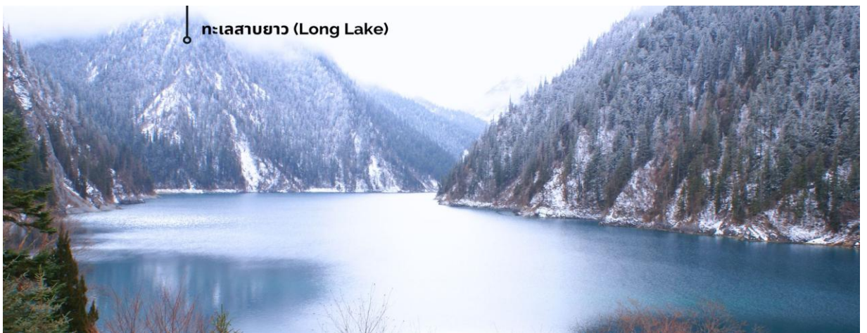
ทะเลสาบยาว (Long Lake)

ทะเลสาบที่ใหญ่ที่สุด สูงที่สุด และลึกที่สุดในจิวจายโกว ด้วยเนื้อที่กว่า 581 ไร่ ความยาวกว่า 7 กิโลเมตร และลึกถึง 103 เมตร ทอดตัวโค้งเป็นรูปพระจันทร์เสี้ยว เนื่องจากหิมะบนภูเขาละลายลงมา น้ำในทะเลสาบสีฟ้าสวยงาม ล้อมรอบด้วยยอดเขาสูงชัน และต้นไม้ขนาดใหญ่ที่ปกคลุมด้วยหิมะ งดงามราวหลุดออกมาจากภาพวาด ความพิเศษในช่วงฤดูหนาว ทะเลสาบจะกลายเป็นน้ำแข็งหนากว่า 60 เซนติเมตร ทำให้นักท่องเที่ยวนิยมมาเล่นสกีตน้ำแข็งกันเป็นจำนวนมาก