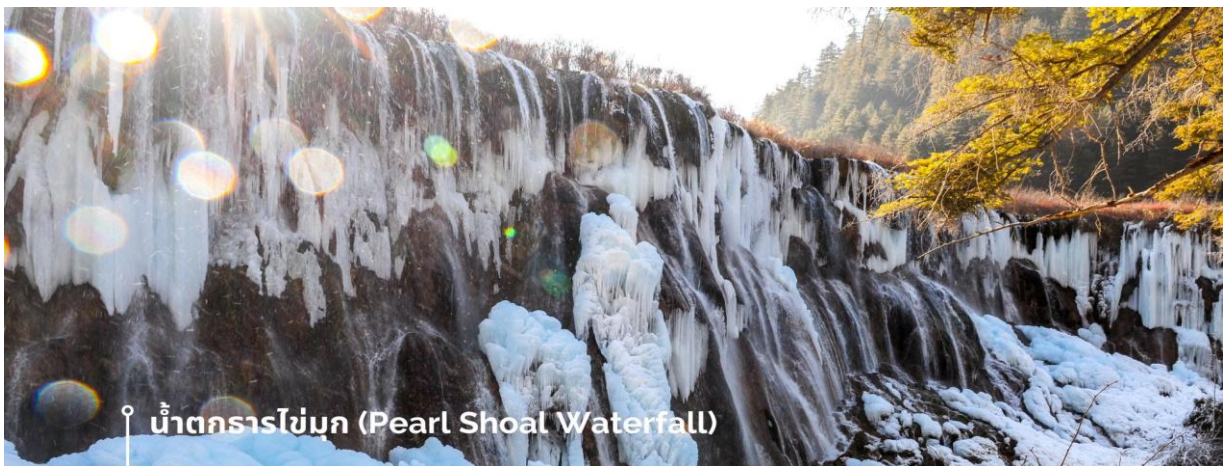
น้ำตกธารไข่มุก (Pearl Shoal Waterfall)

หรือ น้ำตกนุริอหลาง (Nuo Ri Lang Waterfall) ถือเป็นน้ำตกที่ใหญ่ที่สุดในจิวจ้ายโกว มีความสูง 40 เมตร กว้าง 310 เมตร เกิดจากหินปูนที่แข็งตัวจนกลายเป็นรูปทรงคล้ายพัด มีสายธารน้อยใหญ่ไหลผ่านลดหลั่นทอดยาวผ่านชั้นหินต่างๆ ยามมีแสงแดดสาดส่องตกลงกระทบผิวน้ำจะส่องประกายราวกับเส้นไข่มุกเหมือนชื่อน้ำตก บางครั้งอาจได้เห็นสายรุ้งจากแสงแดดที่สะท้อนกับละอองน้ำอีกด้วย หากได้มาในช่วงฤดูหนาว ก็จะได้เห็นหิมะเกาะตามต้นไม้ โขดหิน และถ้าอากาศหนาวมากๆ น้ำที่น้ำตกก็จะกลายเป็นน้ำแข็ง กลายเป็นประติมากรรมจากธรรมชาติที่สวยงาม